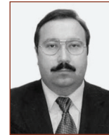
Кийко Михаил Юрьевич, заместитель руководителя Федерального агентства по государственным резервам

тель регионального отделения всероссийского «Общества интеллектуальной истории», член редколлегии журнала «Нефтегазовое дело», автор 2 монографий и 20 статей.